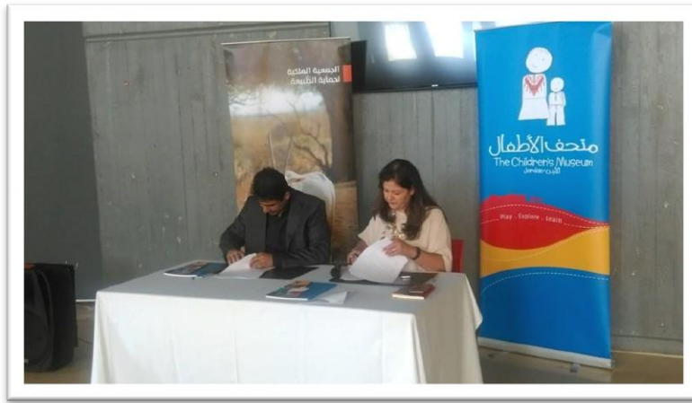
إبرام الاتفاقية 6.8.2015

قامت الجمعية الملكية لحماية الطبيعة بإبرام اتفاقية تعاون مع متحف الأطفال الوطني، وهو مؤسسة وطنية يؤمها أكثر من نصف مليون زائر سنوياً ومعظمهم من الأطفال ومن شتى مناطق المملكة. وبعد إبرام الاتفاقية بدأت التحضيرات لتحديد المفاهيم الأساسية التي ستحتويها المعروضة وتشكلت لجنة مشتركة من قبل الفريق الفني في الجمعية الملكية لحماية الطبيعة وفريق متحف الأطفال بالإضافة لمختصين في المجالات العلمية والمجالات التعليمية. وقد عقدت عدة اجتماعات لتحديد المفاهيم الأولية التي ستبنى عليها المعروضة، وخلصت إلى مفاهيم رئيسة تعنى بالغنى الحيوي للأردن بسبب موقعها الجغرافي بين قارات العالم وأقاليمه المناخية، وبهذا تناولت معروضة التنوع الحيوي للأردن جزءاً جزءاً، فبدأت أولاً في الغابات الشمالية وما فيها من أنواع مميزة، وانتقالاً إلى حفرة الانهدام وما تسببت به من تشكيل فريد للتنوع الحيوي والقيم الجيولوجية، ومروراً بالبادية الشرقية، ثم الانتهاء بصحراء وادي عربة ووادي رم. وفي كل جزئية، تناولت المعروضة أهم الأنواع إما كأنواع منفردة، أو كمجموعات مثل الطيور المهاجرة على طول خط الهجرة، ومن هنا كان لطائر الحبارى نصيباً كبيراً سواء في الطيور المهاجرة أو الطيور المقيمة، بالإضافة إلى المعروضة الخاصة به منفردة وبجهود الحماية وأنشطة المراقبة. كما خصصت المعروضة شاشة خاصة لعرض الفيلم الخاص بالصندوق، ومشروع الحبارى.