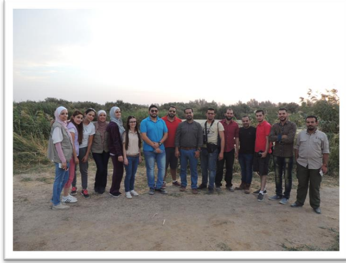
تدريب مدخل الى التنوع الحيوي لكادر متحف الأطفال 22.10.2017