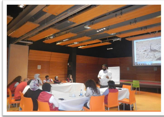
تعريف فريق المتحف بطائر الحبارى .

تطوير ركن / زاوية في متحف الأطفال تحكي قصة التنوع الحيوي في المملكة الأردنية الهاشمية بما فيها حماية حماية طائر الحبارى في الأردن، حيث تقدم لزوار المتحف وبطريقة تفاعلية بعيدة عن النمطية قيم التنوع الحيوي في الأردن وتحدياته، والجهود المبذولة لحمايته، وذلك حتى يقدر زوار المتحف هذه القيم ويحترمها من أجل رفع مستوى الوعي لدى الأطفال بمفاهيم التنوع الحيوي وضرورة حمايته. ونفذ هذا الركن من خلال مشروع إعادة توطين طائر الحبارى والممول من الصندوق الدولي للمحافظة على طائر الحبارى وموقعه إمارة أبو ظبي / دولة الإمارات العربية المتحدة. والذي يهدف الصندوق إلى استعادة أعداد الحبارى البرية واستدامتها في دولة الإمارات العربية المتحدة ودعم برامج الإكثار والحماية في مختلف الدول والمناطق التي تقع ضمن نطاق الانتشار الطبيعي للحبارى. وفي هذا الإطار، يقود الصندوق جهودا عالمية لاستدامة الحبارى مع المحافظة على التراث والتقاليد الثقافية.